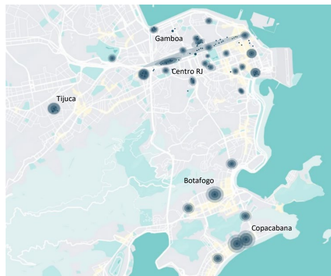
Fig.1: Mapeamento dos focos de permanência noturna no Centro do RJ, Gamboa, Tijuca, Botafogo e Copacabana. Fonte: autores, 2024.

O conjunto de pesquisas que têm se debruçado sobre o problema da população em situação de rua no Brasil demonstra que as pessoas nesta categoria são diversas entre si, e mapear tais “personagens” e seus itinerários de usos (Fig. 1 e 2), no e espaço público urbano, permitirá reconhecer caminhos possíveis para um urbanismo solidário, voltado para a solução de corpos, e não para a manutenção exclusiva de máquinas.