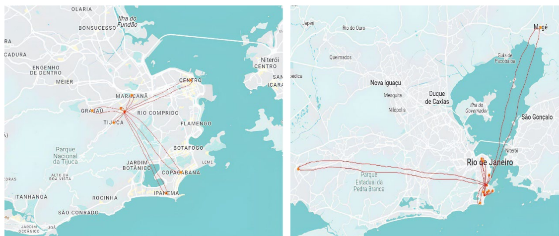
Fig.9: Mapa-deambulante extraído a partir de entrevistas realizadas na Tijuca (à esq.).