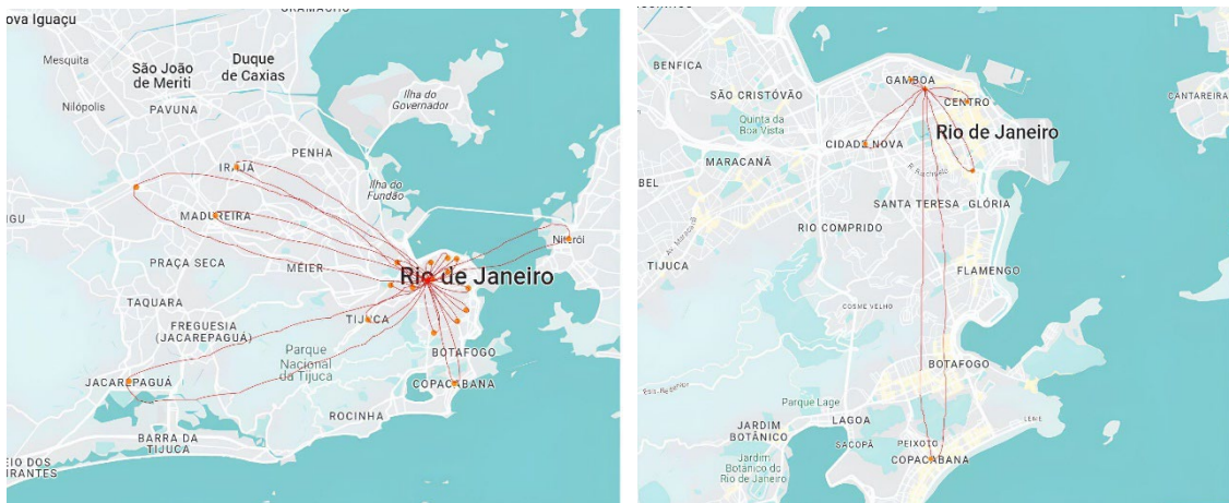
Fig.7: Mapa-deambulante extraído a partir de entrevistas realizadas no Centro (à esq.).

A partir do vínculo já percebido entre a rua e os interlocutores, foi possível contruir um mapa-deambulante, como que ‘alças’ (de ir e vir) entre o desejo/necessidade de deambular e o ato de retornar. O ir e vir expressa o desejo do corpo que a cidade realiza. A partir dos dados fornecidos pelas pessoas em situação de rua nos cinco bairros já analisados, em horário noturno, desenvolvemos as primeiras cartografias – que marcam pontos de interesse pessoal na cidade, muitas vezes associados a um local de trabalho, fornecimento de comida, visita à família, retorno a sua casa original ou visita aos amigos. É possível identificar a partir desses mapas-deambulantes as diferentes distâncias que alguns desses entrevistados percorrem durante um único dia para que no fim do mesmo, retornem ao lugar de pernoite compartilhado pelo grupo: