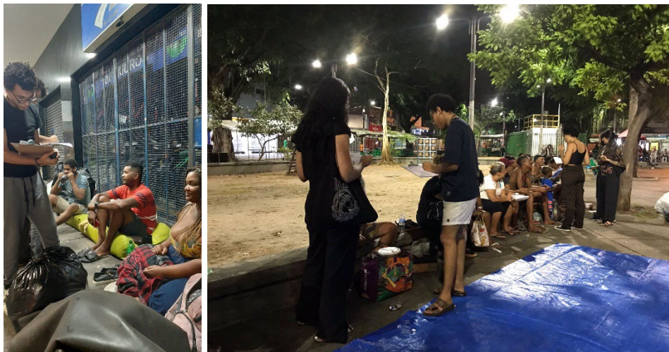
Fig.5: Entrevista direta com os interlocutores, realizada no bairro Copacabana, RJ.